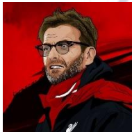
Jürgen Klopp's Borussia Dortmund - Attacking Tactics

Σε αυτή την άσκηση ο στόχος της ομάδας που κατέχει την μπάλα είναι να περάσει η μπάλα στον διαρκώς κινούμενο ουδέτερο παίκτη μέσα στον κύκλο που παίζει με μια επαφή στον άλλο ουδέτερο παίκτη.